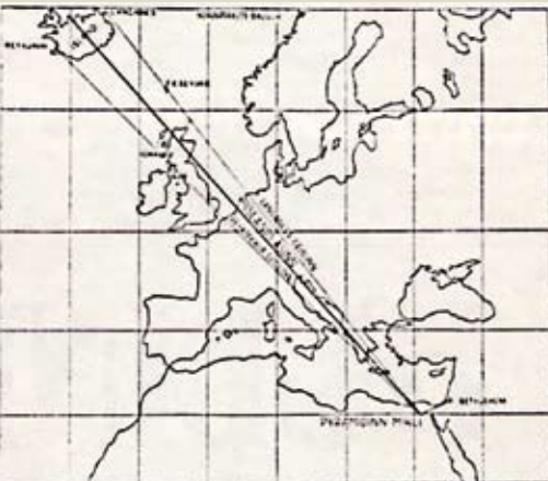
Skýringamynd úr riti Adams Rutherford, Hin mikla arfleifð Íslands, sem út kom á íslensku árið 1939. Myndin sýnir á hvern hátt Pýramíðinn mikli vísar á Ísland annars vegar og Betlehem hins vegar.